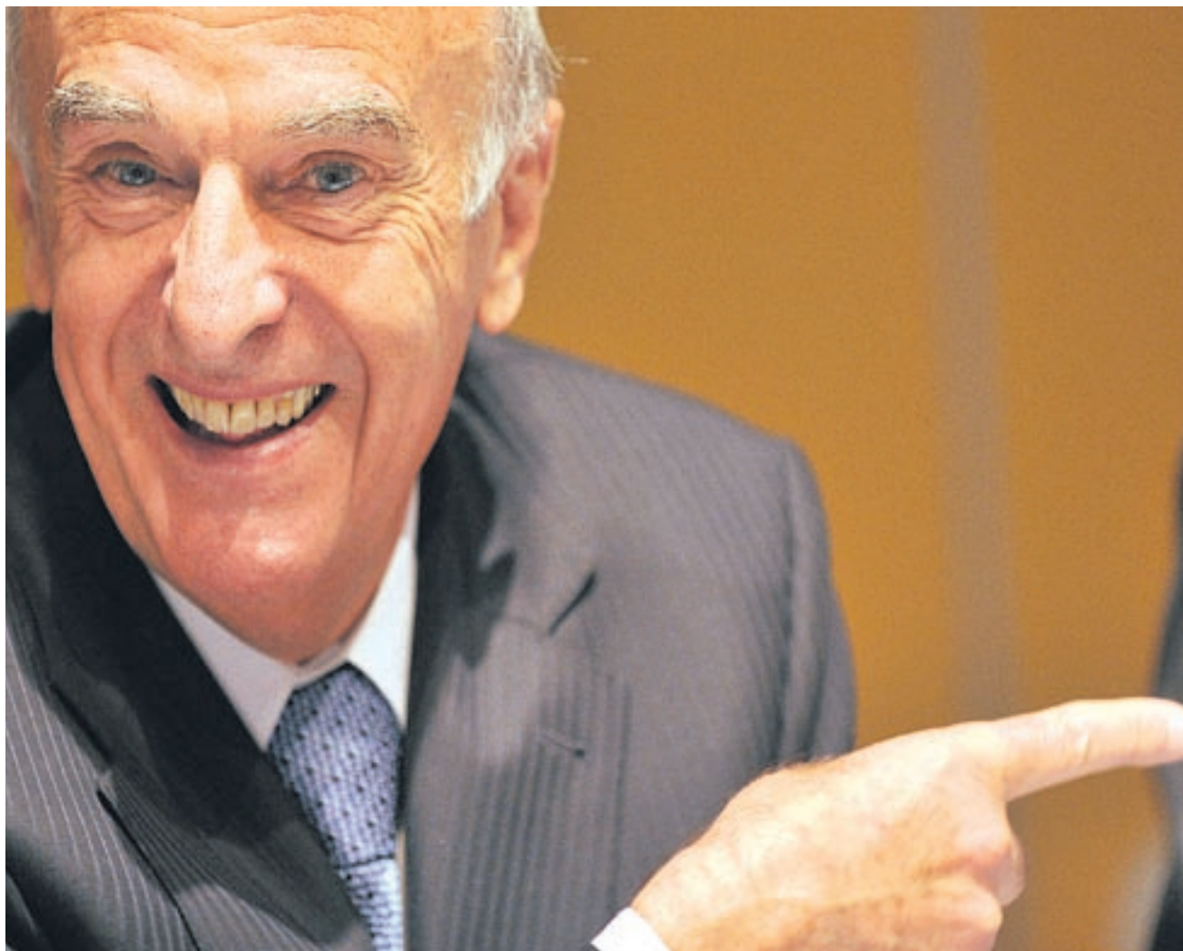
Zufrieden mit seinem Jahr als Bundespräsident ist nur Bundesrat Hans-Rudolf Merz selber – und die FDP.

FDP-Präsident Pelli fürchtet offenbar, in der Ersatzwahl für Merz den zwei-