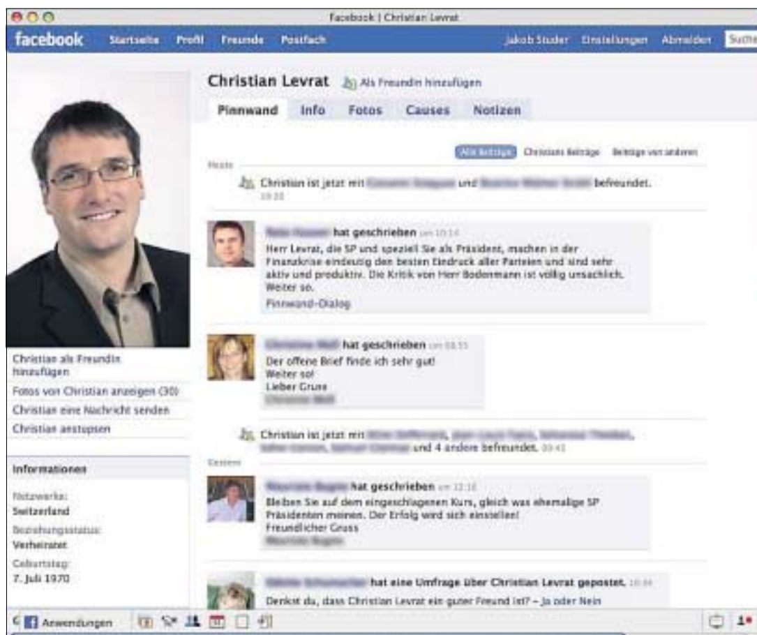
SP-Präsident Christian Levrats «Pinnwand» auf Facebook am 11. März.