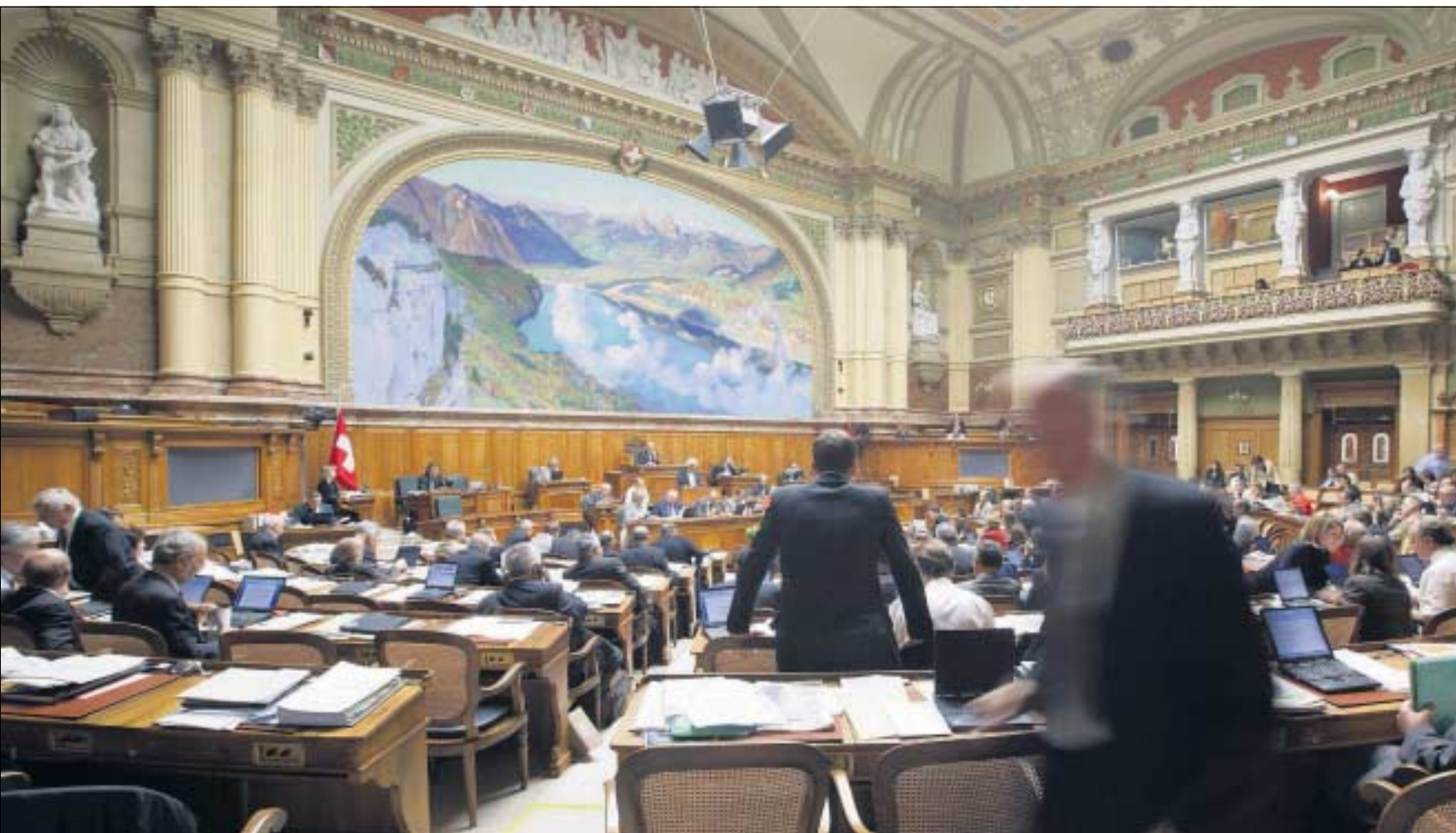
Nationalratsdebatte am 16. September 2008 während der Herbstsession: Die Mehrheiten haben sich neu konstituiert.